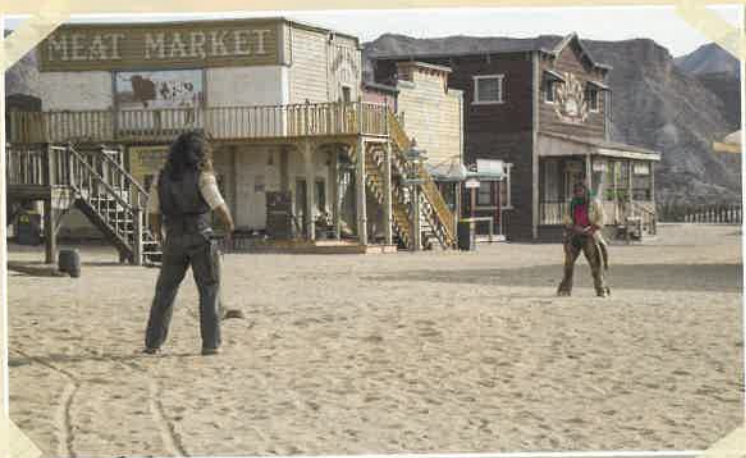
Vesterni prikazujejo belce kot junake.

Plavi vojak (Soldier blue). Brutalen in krvav napad ameriške konjenice na mirno indijansko šotorsko naselje je prvokrat pokazal resnico o odnosu do staroselcev. Nato je leta 1972 veliki igralec Marlon Brando zavrnil najvišje filmsko priznanje – nagrado oskar. Na slovesni podelitvi je staroselka prebrala njegovo protestno pismo proti nerešenemu indijanskemu vprašanju.