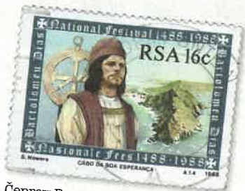
Čeprav Bartholomeo Diaz ni priplul do Indije, je Portugalski prinesel veliko zmago.

značilna bolezen pomorščakov, ki nastopi zaradi pomanjkanja vitaminov, torej sveže zelenjave. Potem pa se je nekega dne vendarle zgodilo. Trud je bil poplačan. Nenadoma je odprava spoznala, da ne pluje več proti jugu, temveč proti vzhodu in severu. Torej je bilo Afrike vendarle konec. Po vrnitvi v domovino je portugalski kralj rt, ki ga je obkrožil Diaz, poimenoval Rt dobrega upanja. Pomorska pot v Indijo je bila odprta.